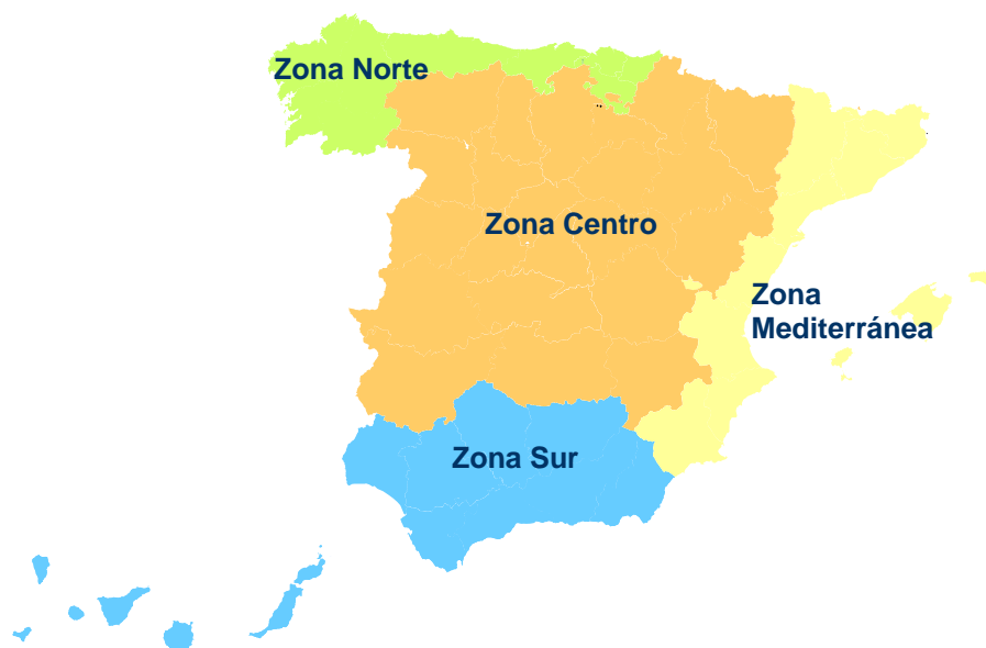
Figura 1. Zonas de estratificación geográfica del muestreo

Atendiendo a la distribución de los censos (Tabla 3) y de las diferentes áreas de invernada en España, se estratificará la toma de muestras en cuatro áreas geográficas (Figura 1): Zona Norte; Zona Mediterránea (incluye Ceuta); Zona Centro; Zona Sur